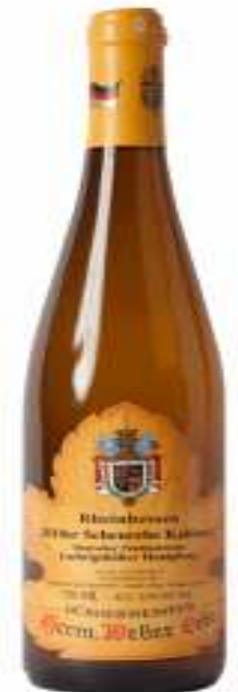
Bild entspricht nicht dem Originaletikett